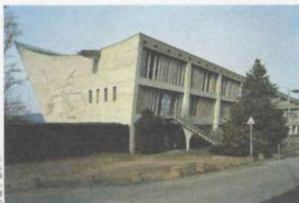
Le Corbusier, Maison de la Culture, Firminy, 1956 Photographie : Olivier Martin-Gambier 2008 © FLC/ADAPF