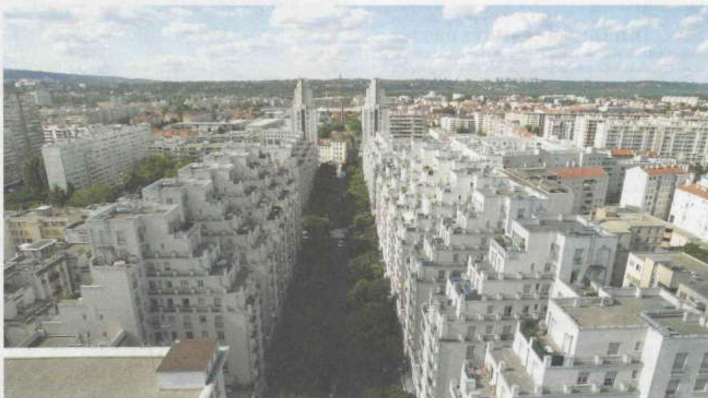
Gratte-Ciel de Villeurbanne